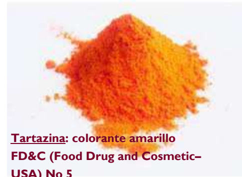
Tartrazina: colorante amarillo FD&C (Food Drug and Cosmetic-USA) No 5

Un médico (Dr. Lockey) confirmó que la paciente estaba reaccionando sólo a la tartrazina y pudo mediante el lavado del