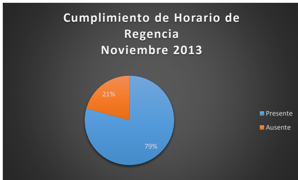
Gráfico No. 2

Respecto al cumplimiento en el horario de regencia farmacéutica, el 79% de los regentes se encontraron presentes en la droguería, contrario a un 21% que estuvieron ausentes a la hora de la visita.