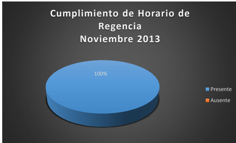
Gráfico No. 3

Respecto al cumplimiento en el horario de regencia farmacéutica, el 100% de los regentes se encontraron presentes en la farmacia a la hora de la visita.